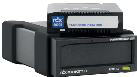
Das RDX QuikStor von Tandberg Data ist ein Wechselplattensystem mit herausnehmbaren Medien, das robusten, zuverlässigen und komfortablen Speicherplatz für Datensicherung, Archivierung und Datenaustausch für kleine und mittlere Unternehmen zur Verfügung stellt.